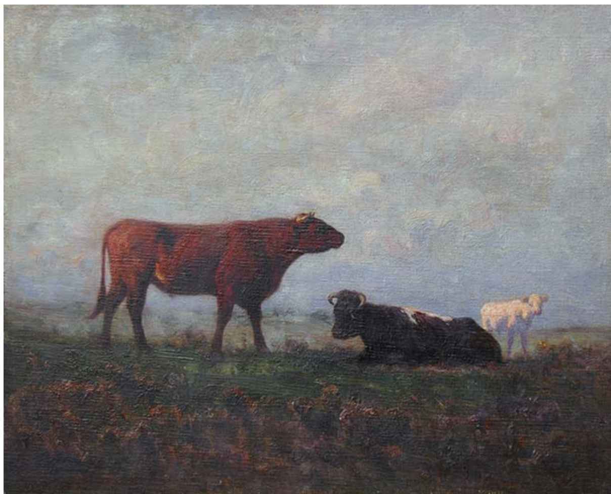
SOL DE LA TARDE EN EL POTRERO