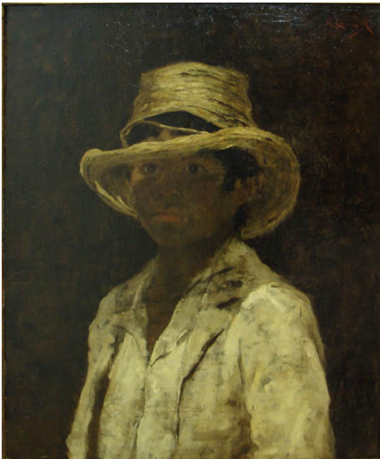
RETRATO DE NIÑO