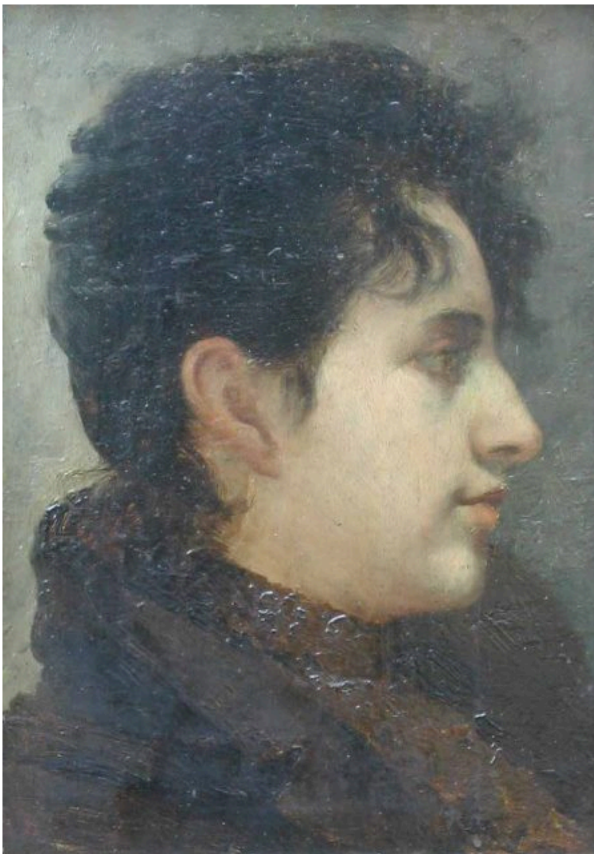
RETRATO DE MI MADRE