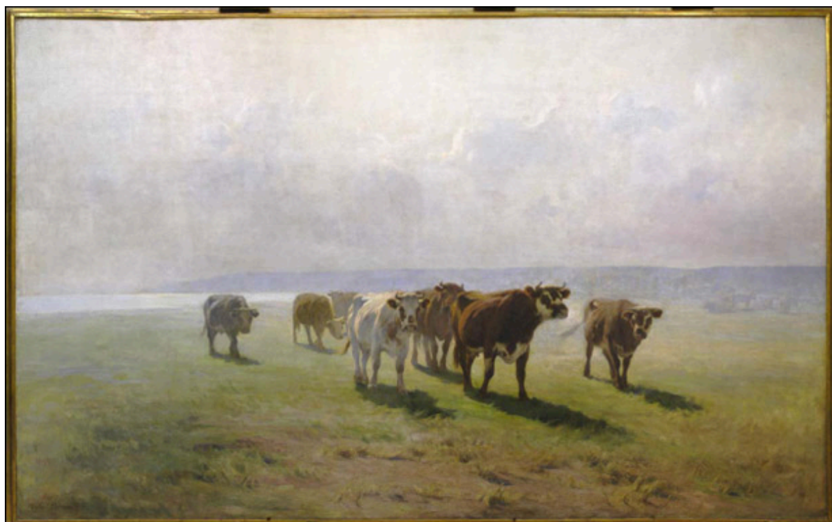
EN LA PRADERA