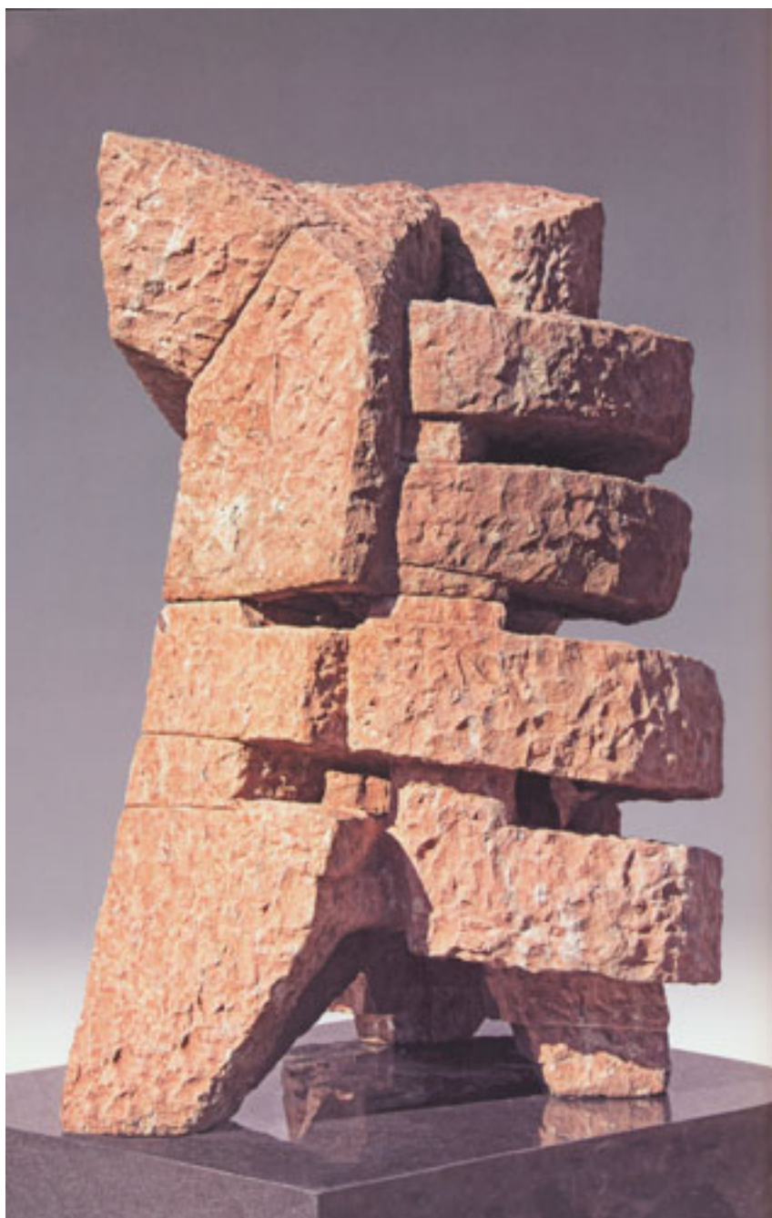
SELENITA (abrazo lunar)