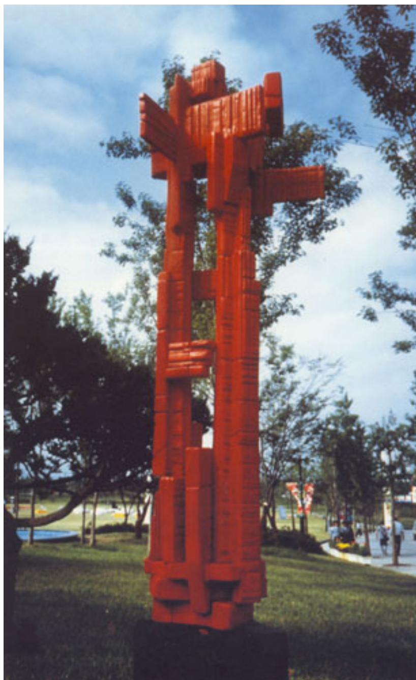
SEÑAL DEL ORIENTE Y OCCIDENTE