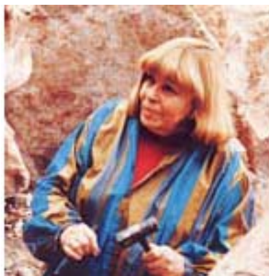
Marta Colvin Andrade