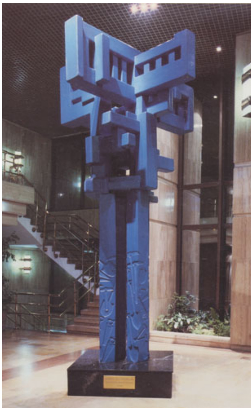
HIMNO AL TRABAJO