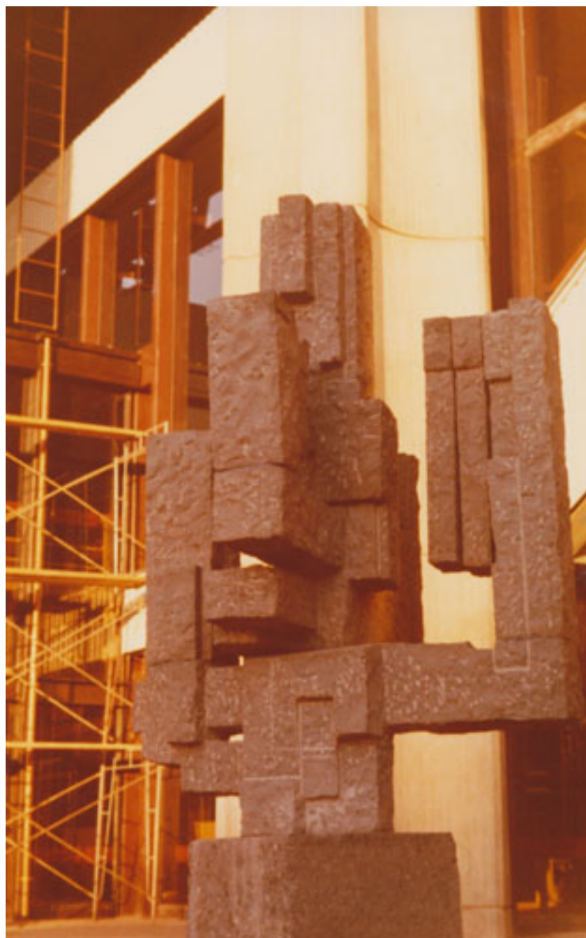
ÁRBOL DE LA VIDA