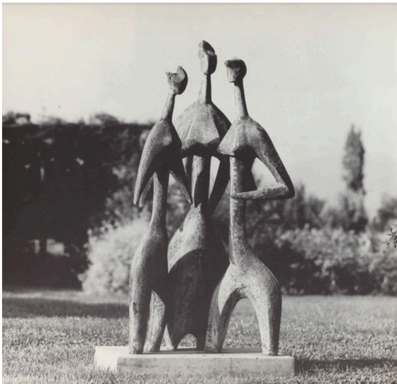
LAS TRES PASCUALAS