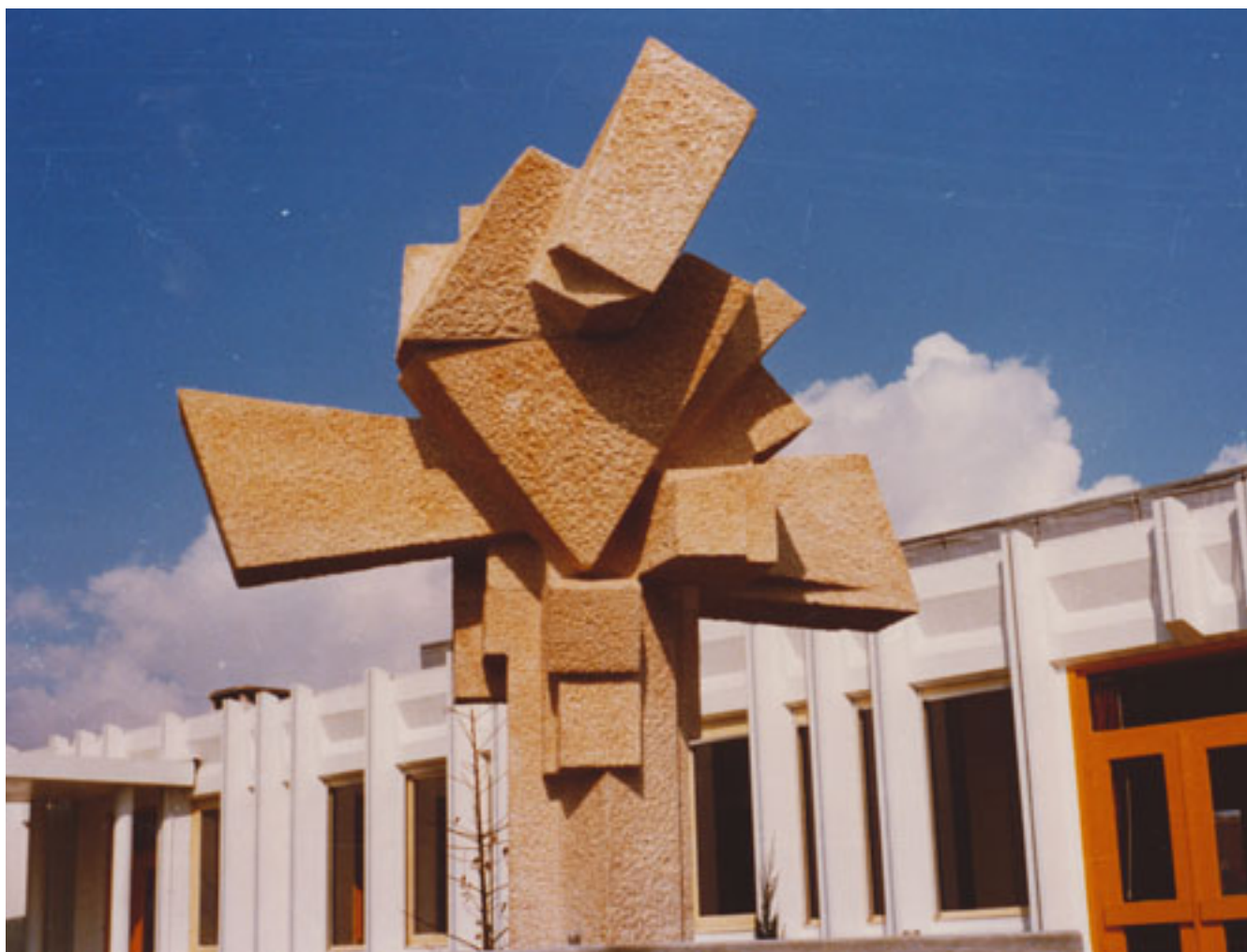
ROSA DE LOS VIENTOS