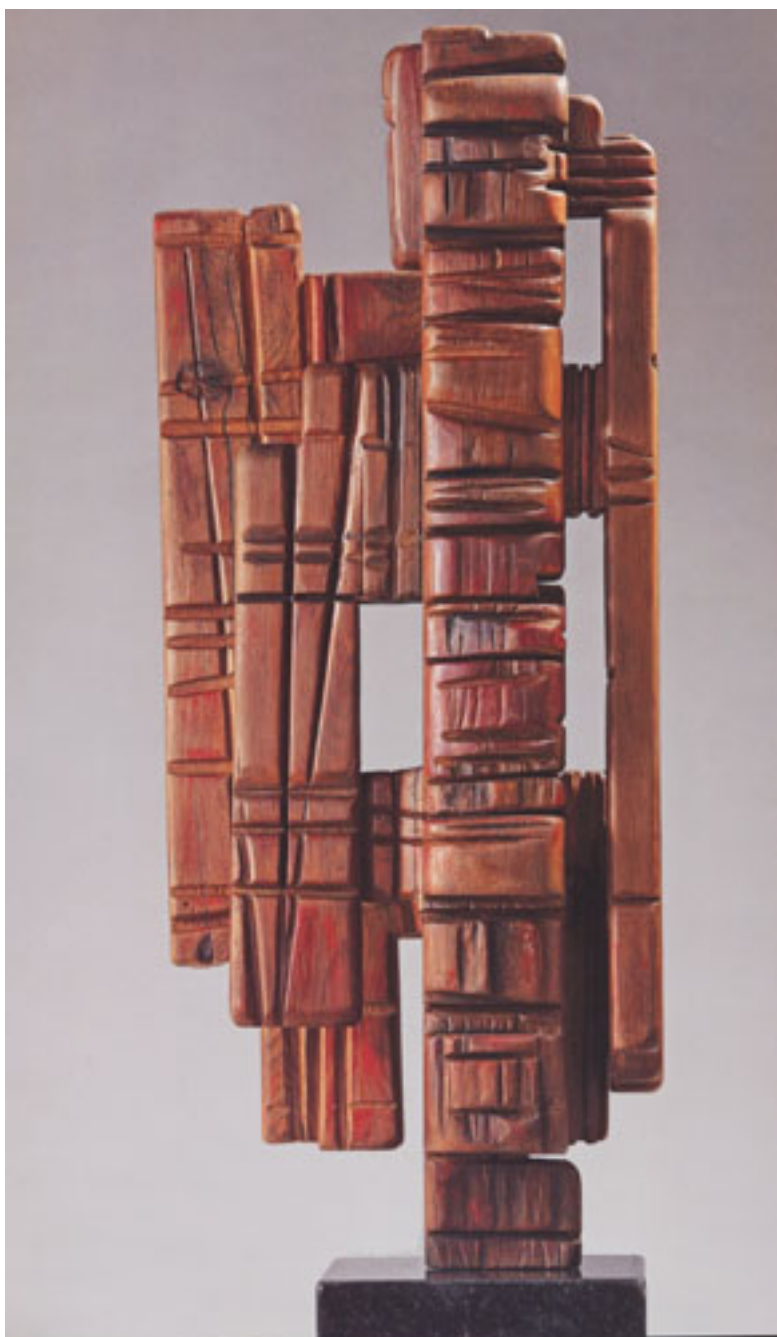
ARIKI (HOMENAJE A HOTU MATU'A)