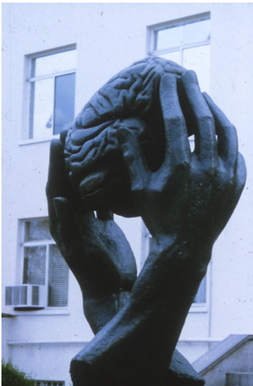
HOMENAJE A LA NEUROCIRUGÍA