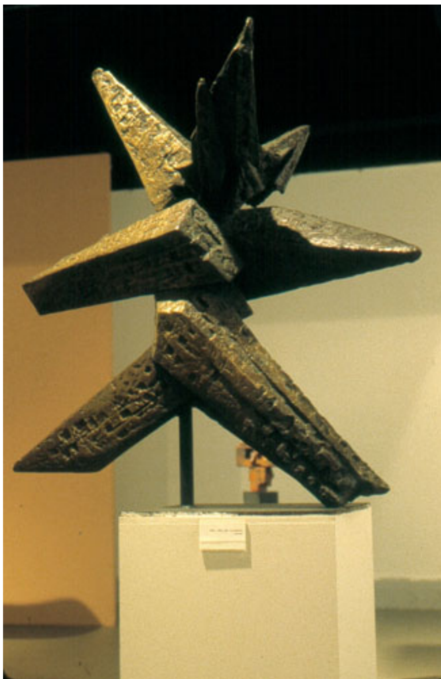
ESTRELLA DEL SUR