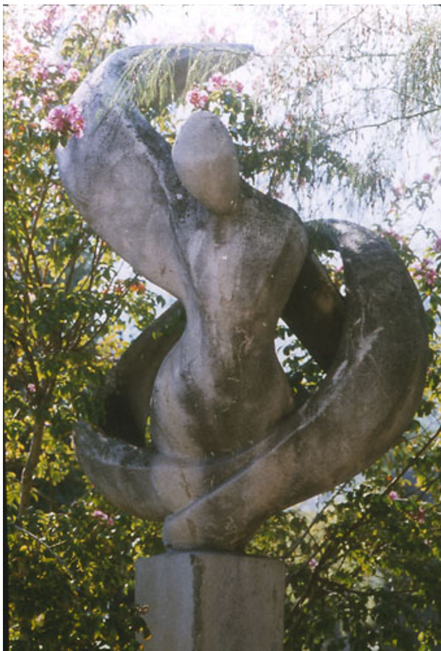
DANZA PARA TU SOMBRA