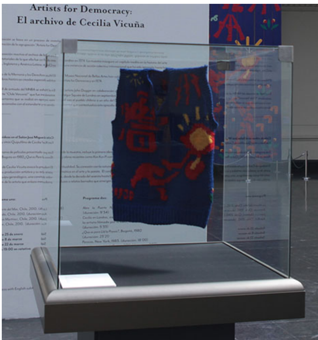
ARTIST FOR DEMOCRACY