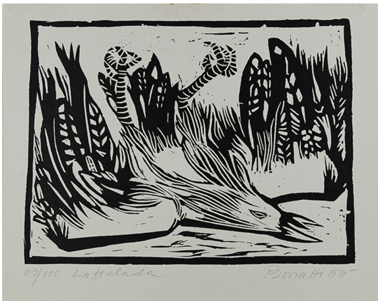
LA HELADA, de la carpeta "5 Grabados Bonatti"