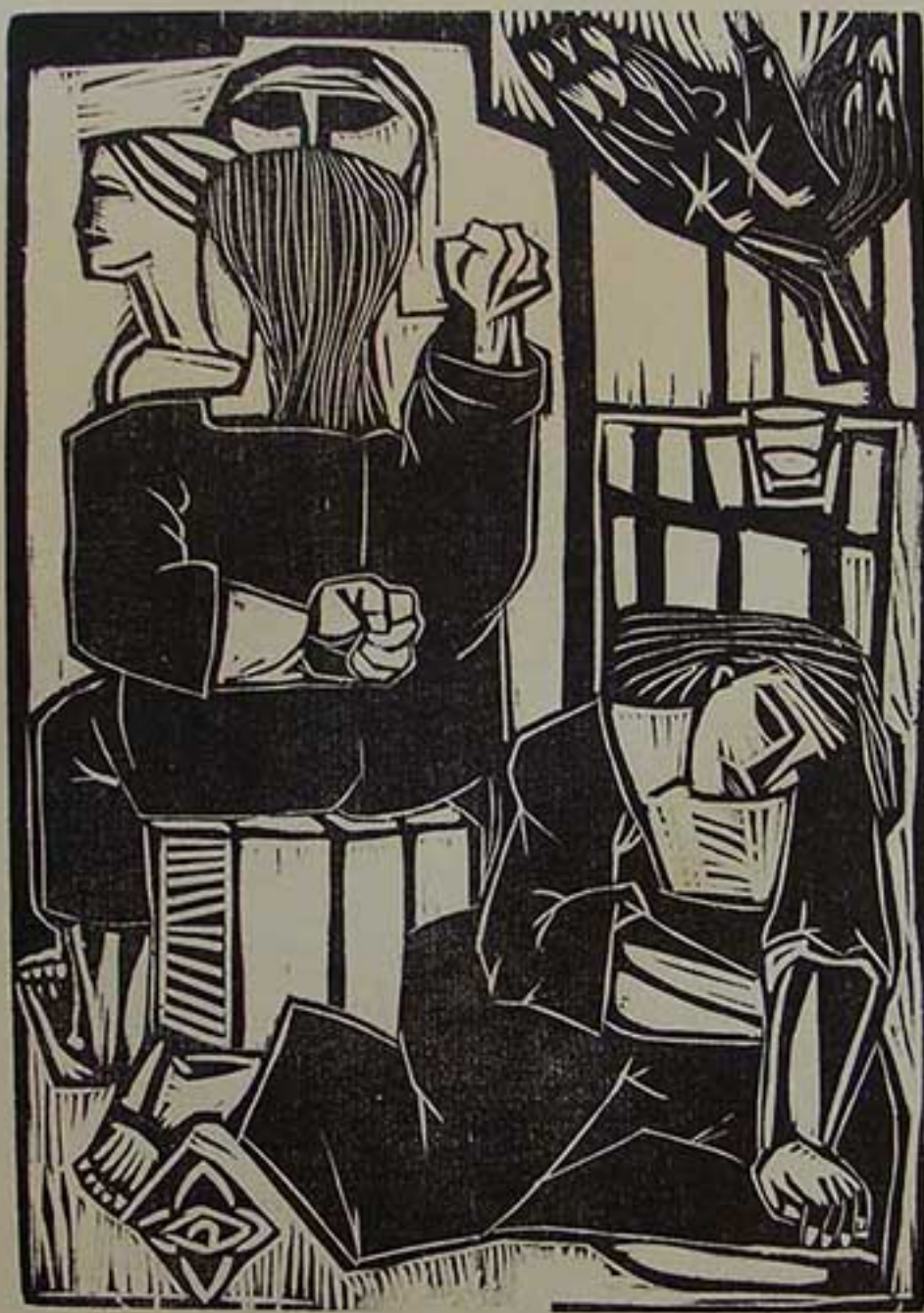
LA ABANDONADA A LOS ESPEJOS (de la carpeta Las Marionetas)