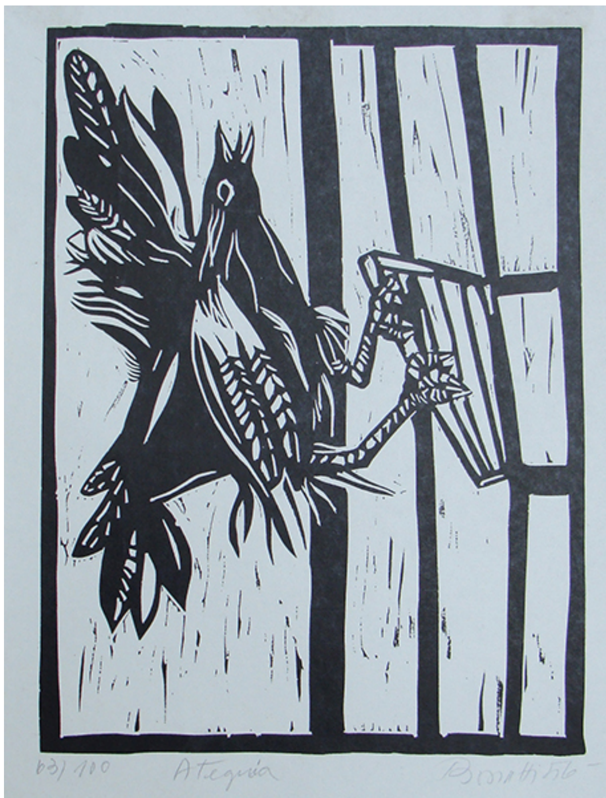
ALEGRÍA, de la carpeta "5 Grabados Bonatti"