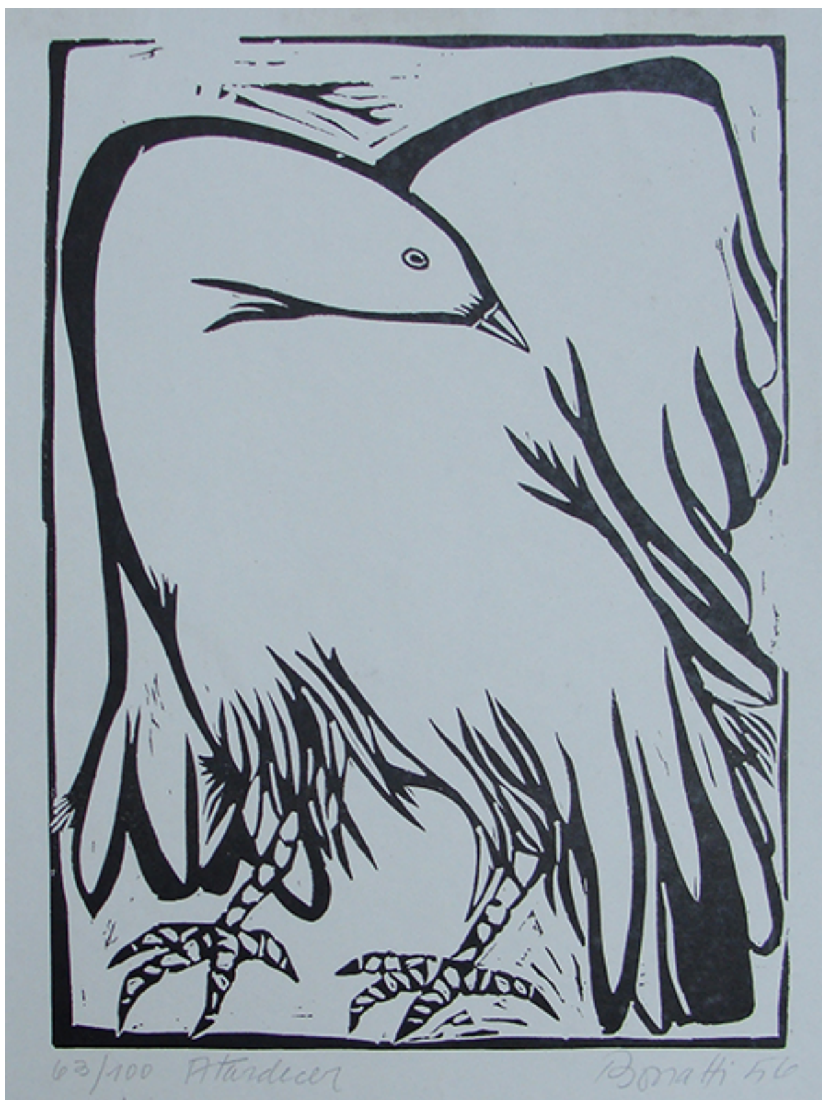
ATARDECER, de la carpeta "5 Grabados Bonatti"