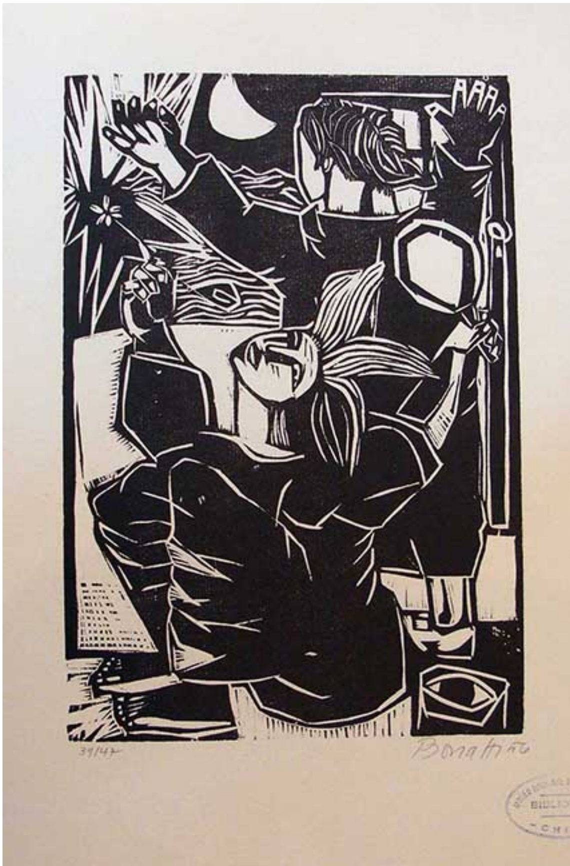
CONJURO DEL FANTASMA (de la carpeta Las Marionetas)