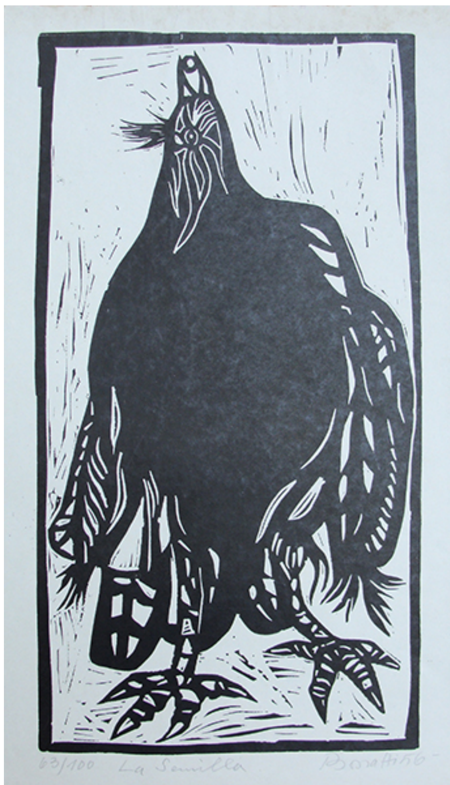
LA SEMILLA, de la carpeta "5 Grabados Bonatti"