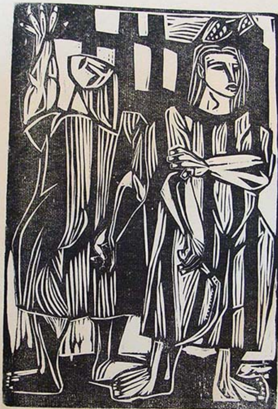
ARCANO SEIS, de la carpeta "Las Marionetas"