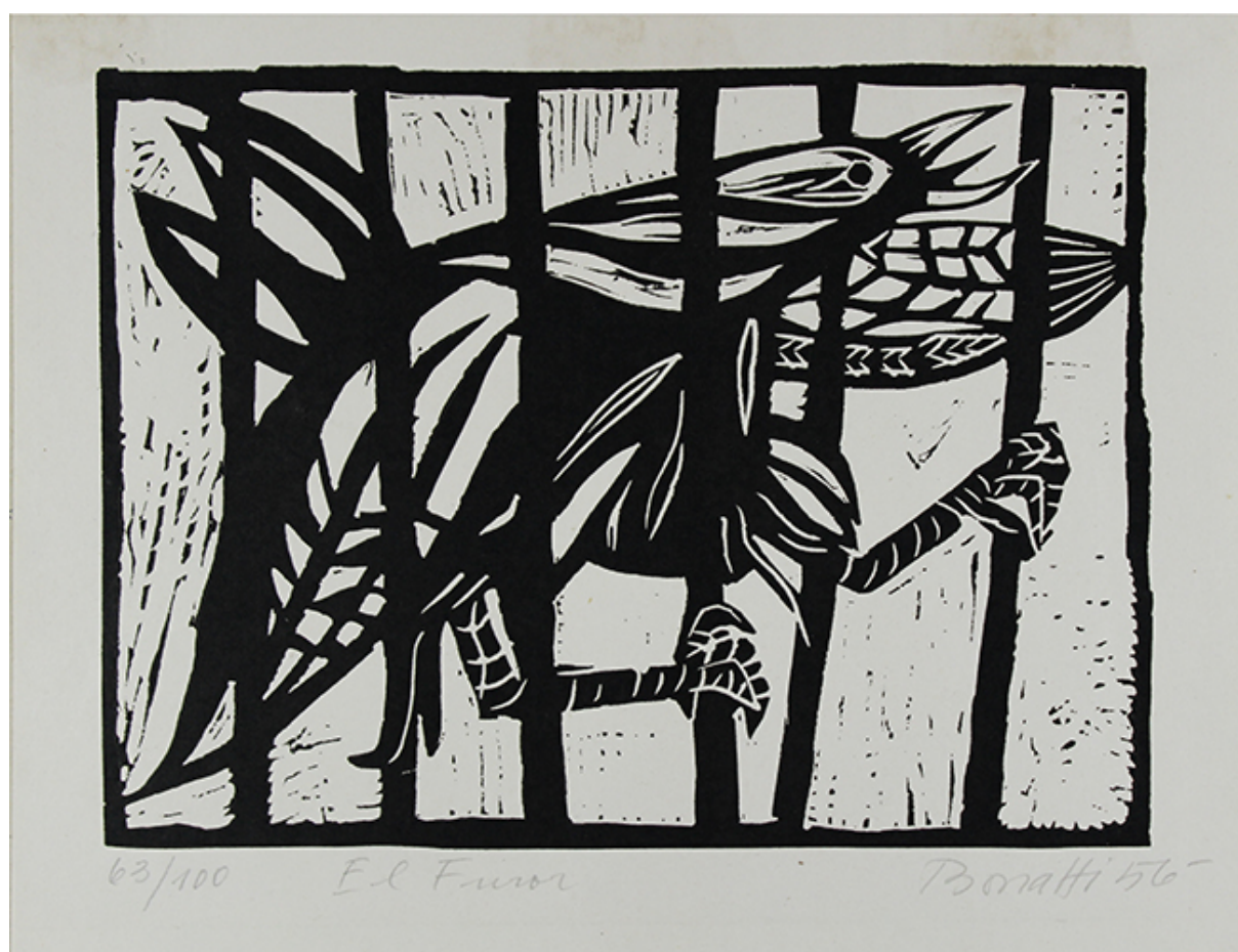
EL FUROR, de la carpeta "5 Grabados Bonatti"