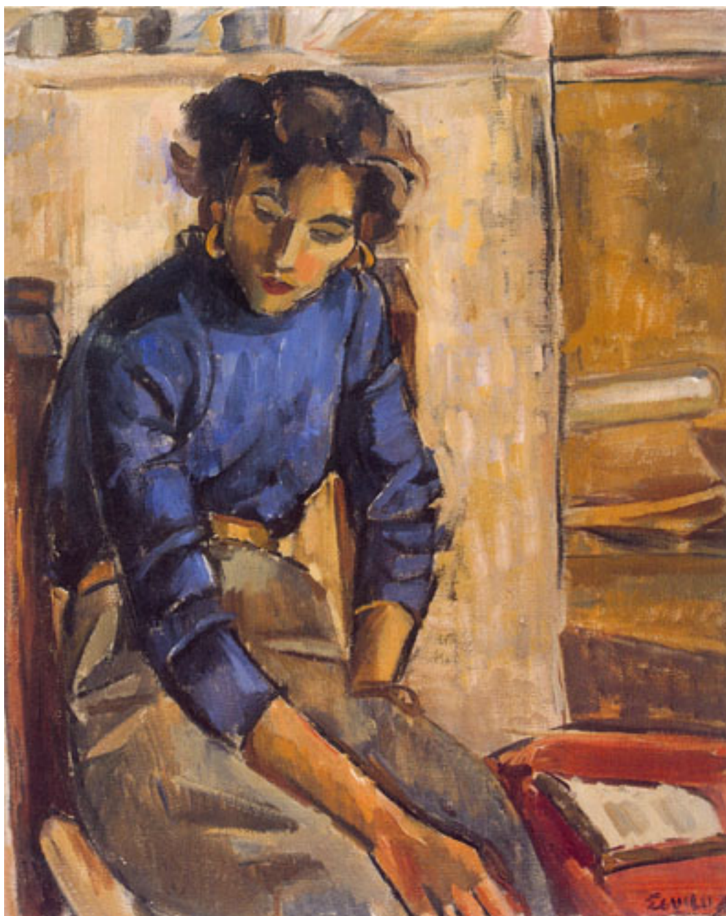
LA NIÑA DE LA BLUSA AZUL