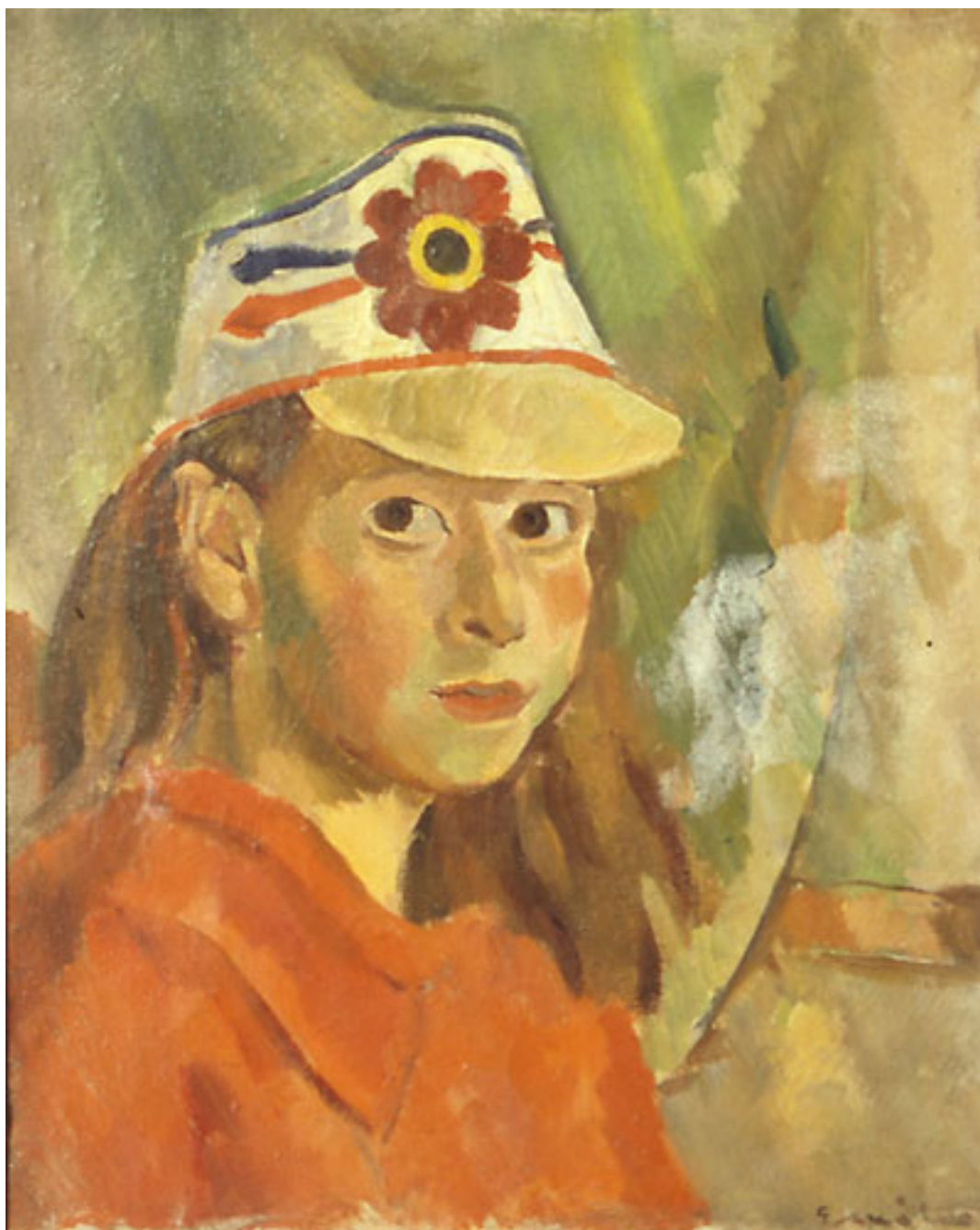
NIÑA CON QUEPIS