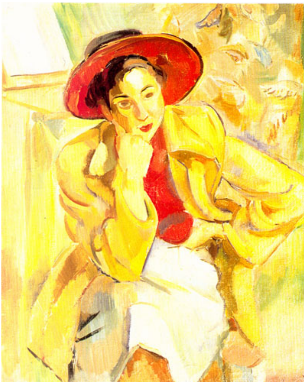
MUJER CON SOMBRERO ROJO