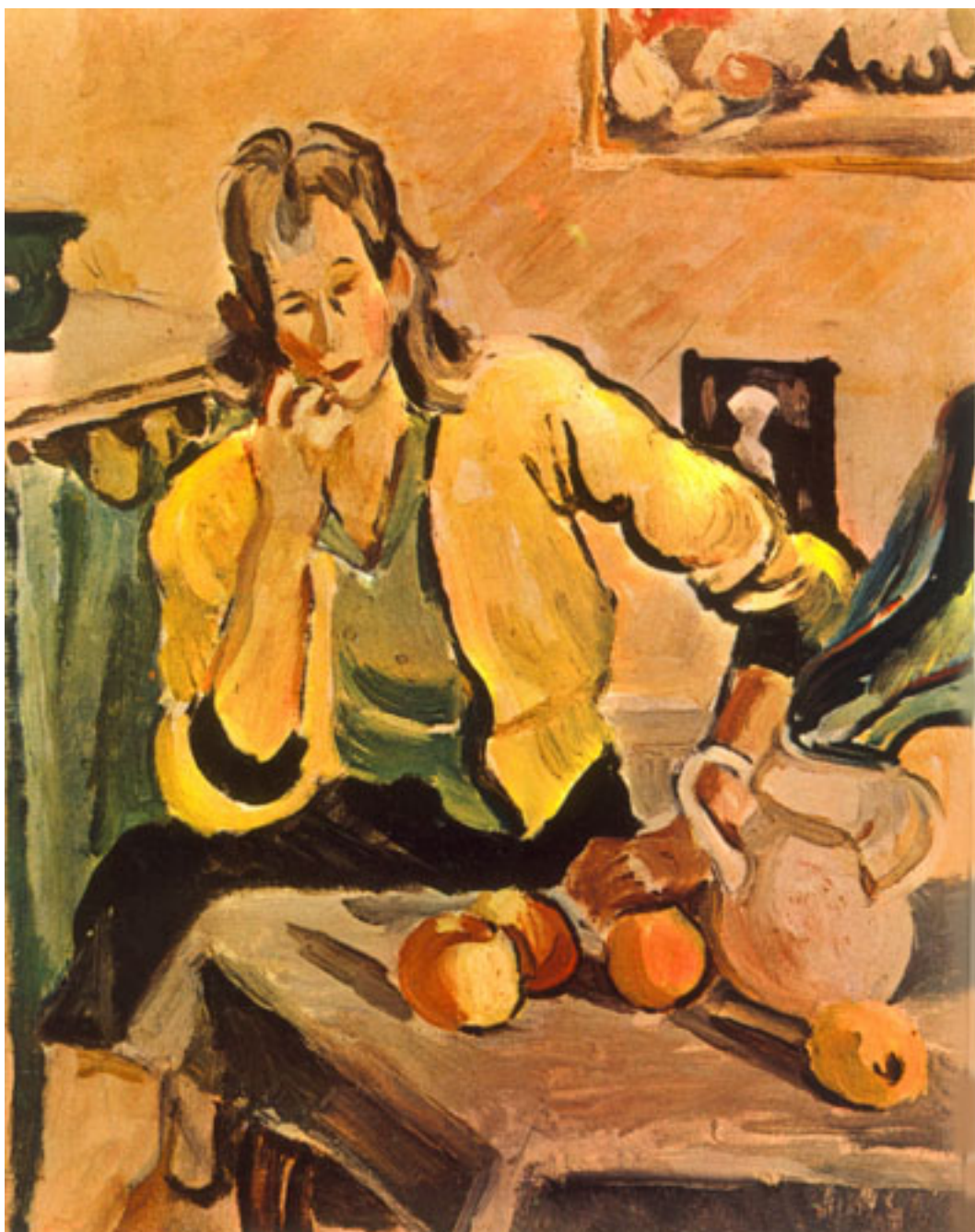
EL JERSEY AMARILLO