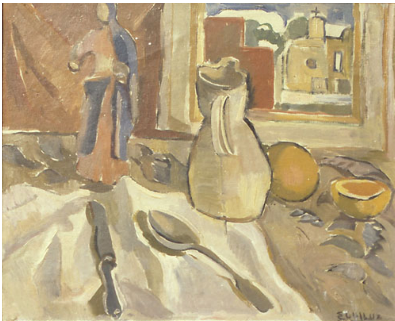
EL CACHARRO GRIS