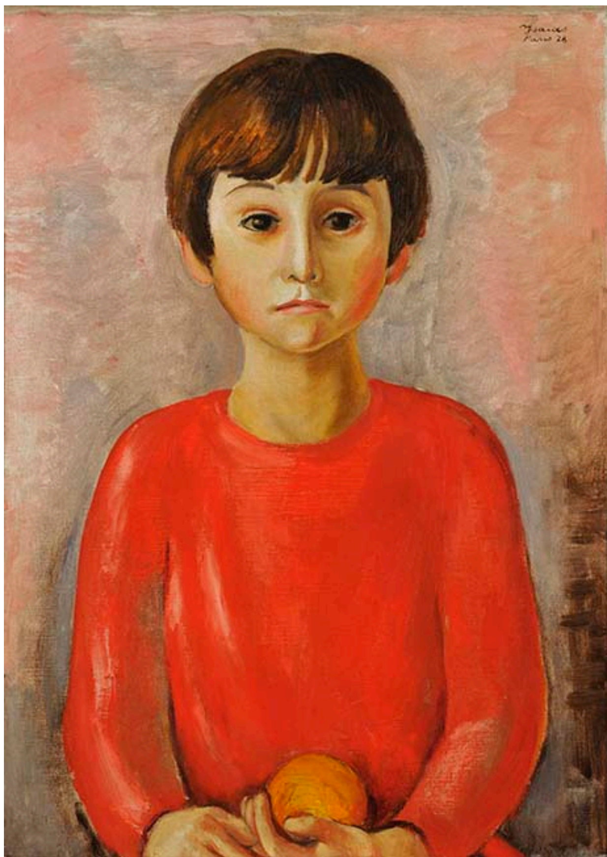
NIÑO DE LA NARANJA