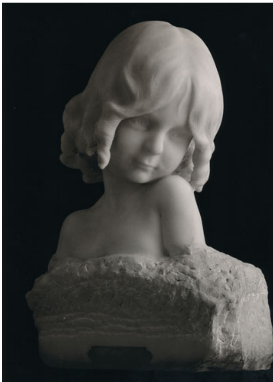
LILY ÍÑIGUEZ MATTE