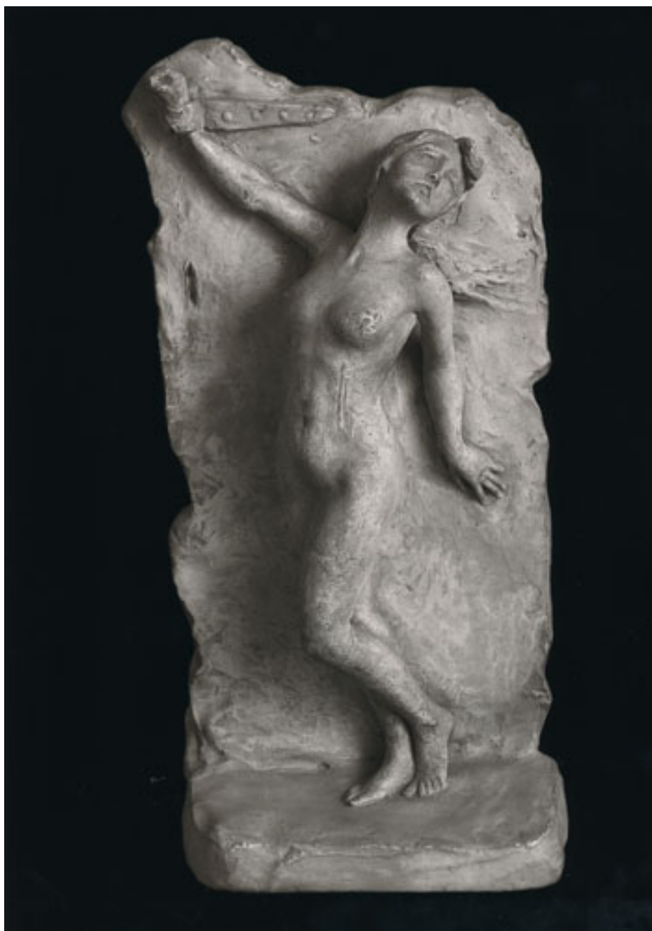
ESCLAVA, ESCLAVA EN EL MERCADO o TRATA DE BLANCAS