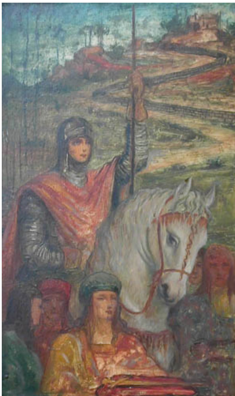
JUANA DE ARCO