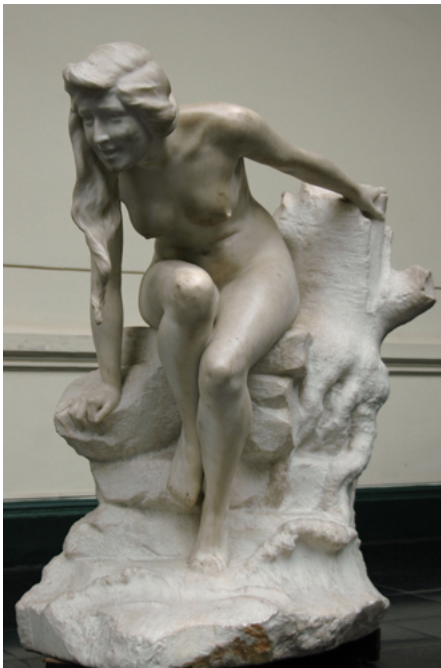
ECO, ENCANTAMIENTO, o ENSOÑACIÓN