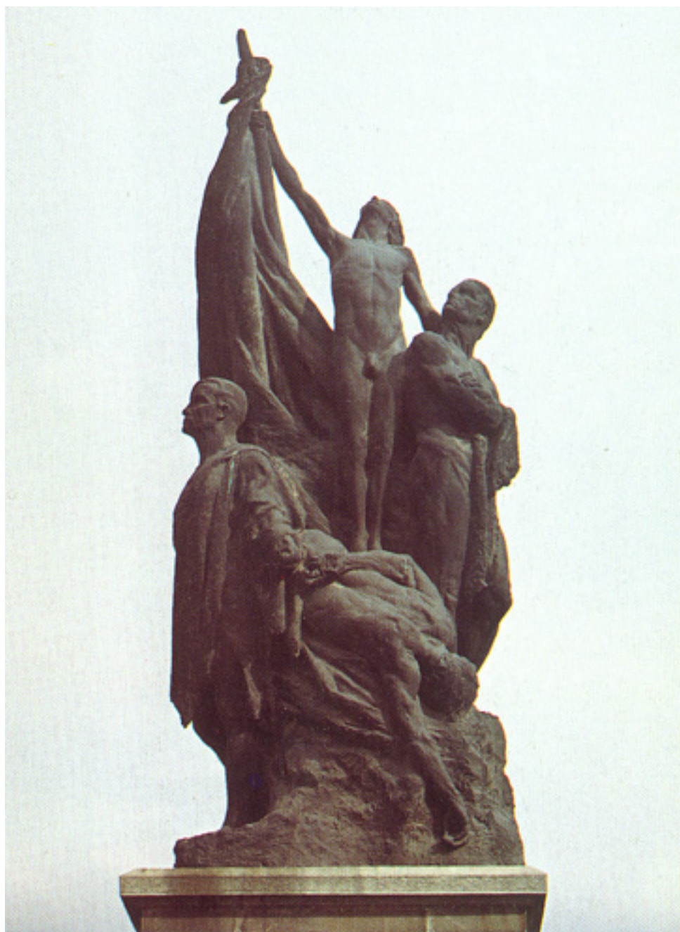
LOS HÉROES DE LA CONCEPCIÓN