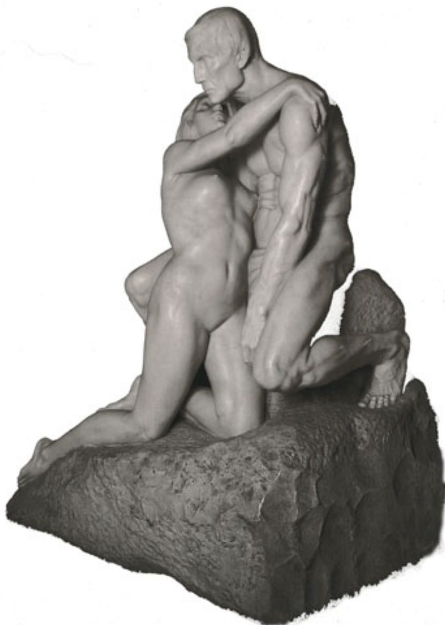
ULISES Y CALIPSO