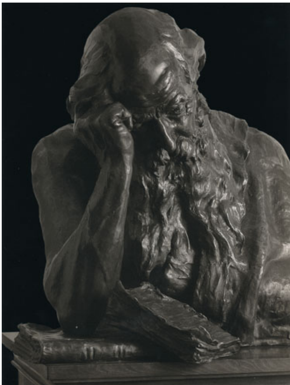
MEDITACIÓN O EL PENSADOR