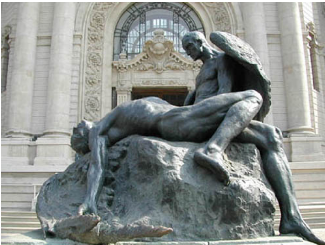
UNIDOS EN LA GLORIA Y EN LA MUERTE, ÍCARO Y DÉDALO o MONUMENTO A LA AVIACIÓN