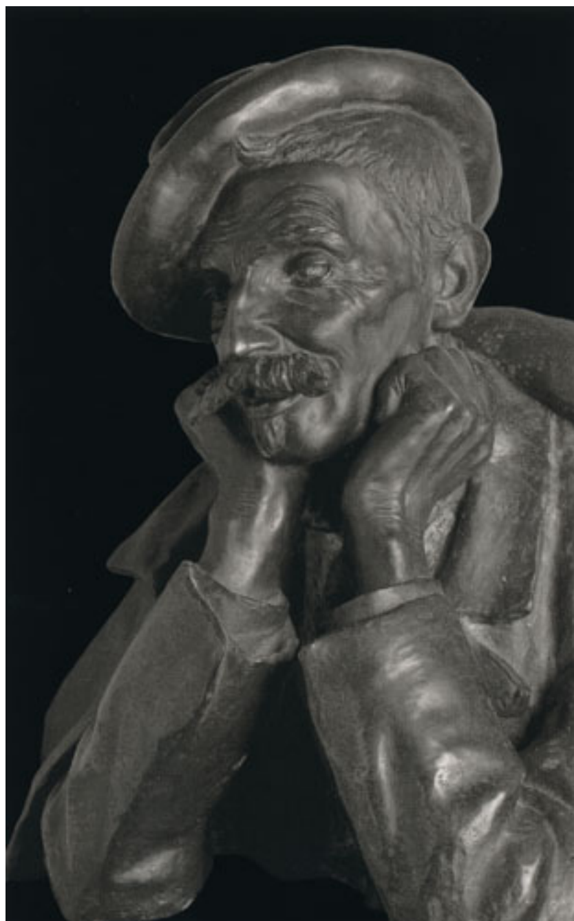
ENRIQUE OVALLE REYES