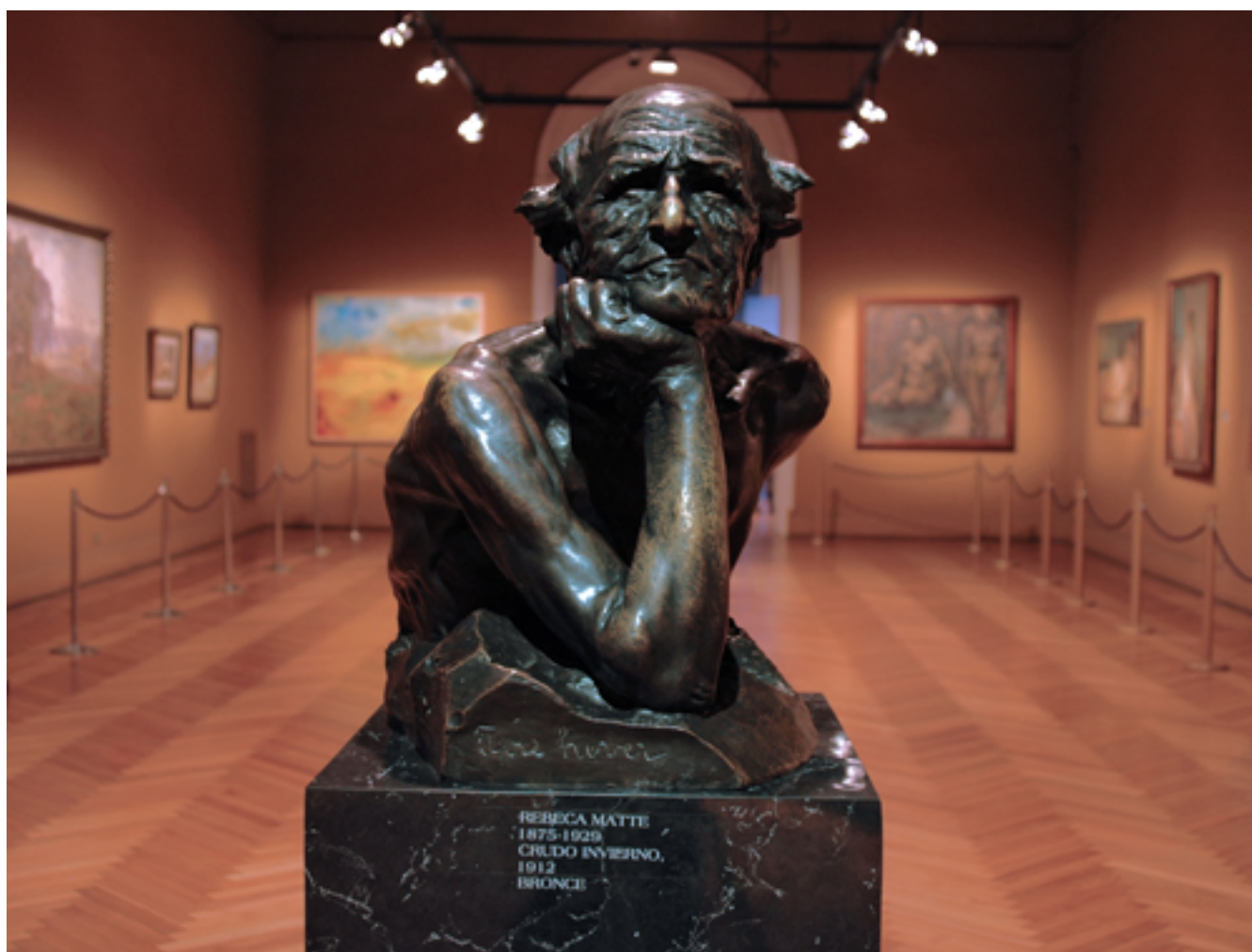
CRUDO INVIERNO o EL LUCHADOR