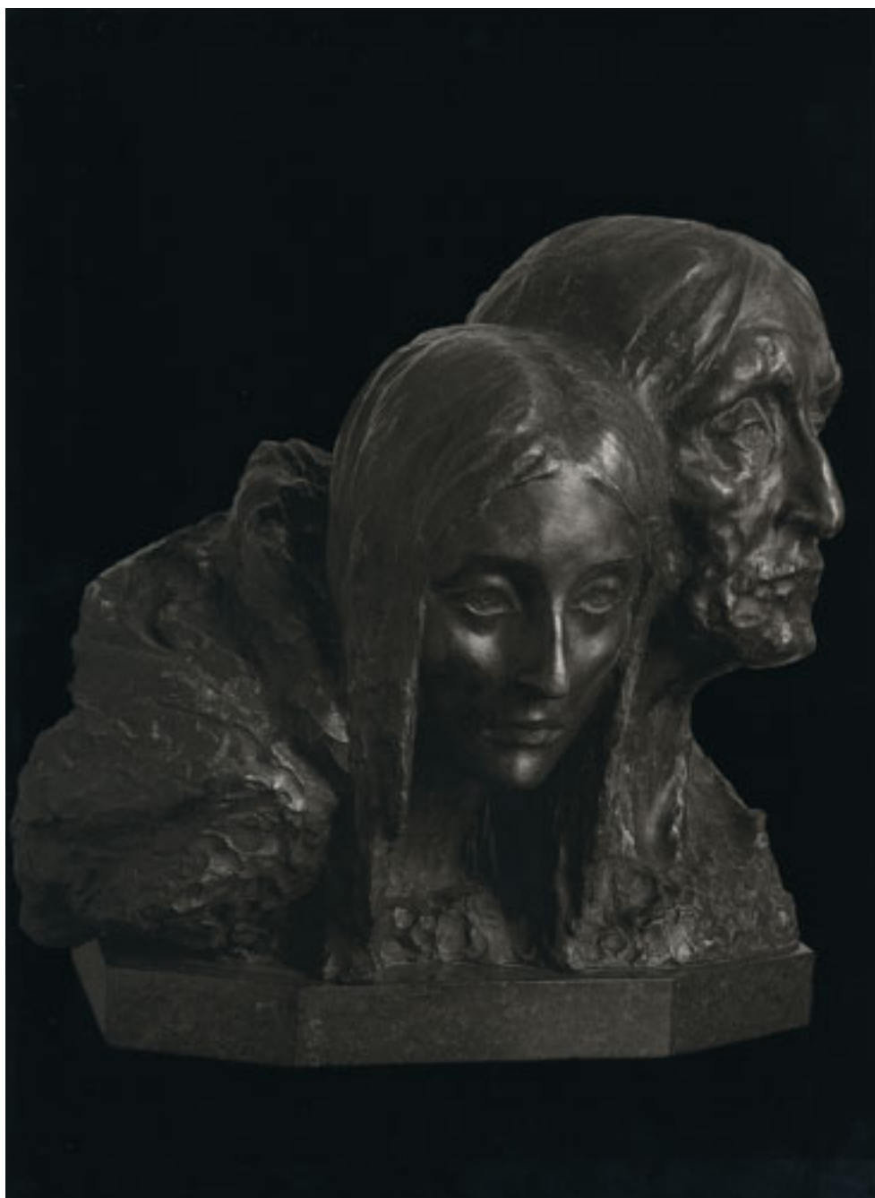
EDADES DE LA VIDA