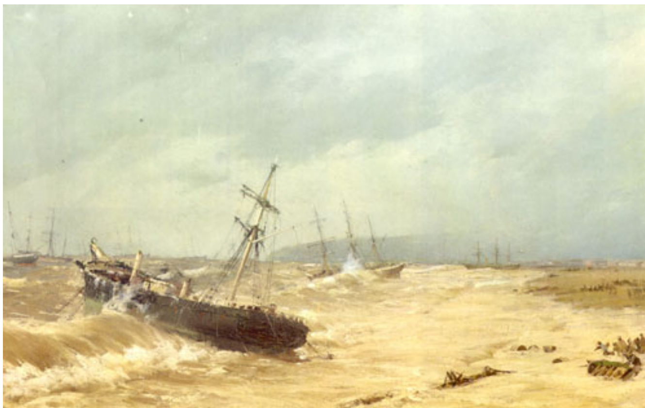
LA ESMERALDA VARADA POR LA TEMPESTAD EN VALPARAÍSO