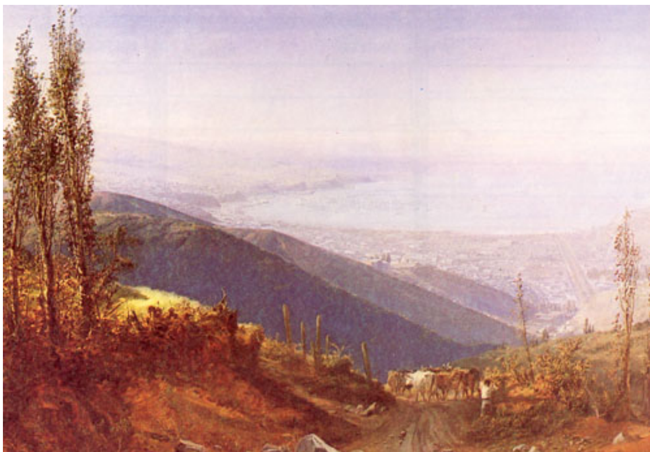
VISTA DE VALPARAÍSO