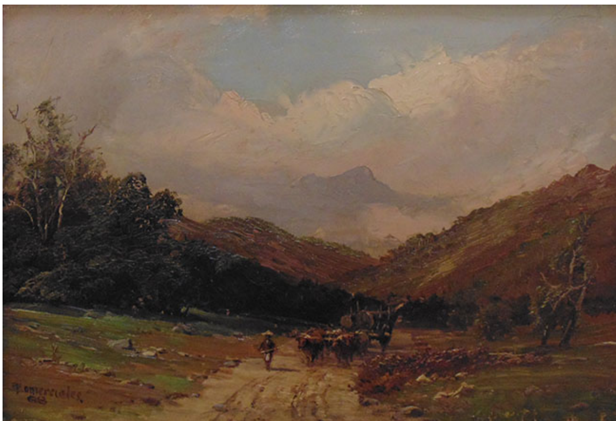
PAISAJE CON CARRETA