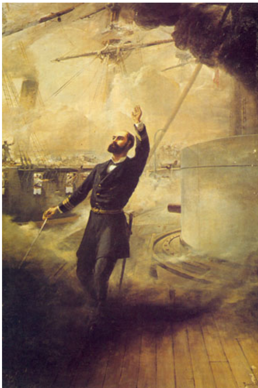
MUERTE DE PRAT