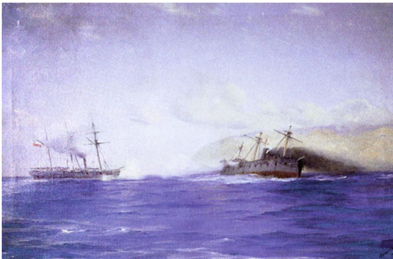
COMBATE DE PUNTA GRUESA