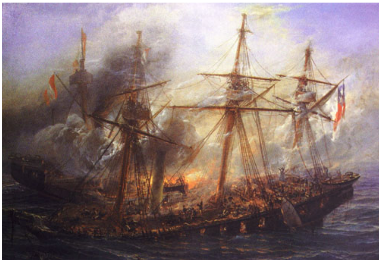
COMBATE DE IQUIQUE