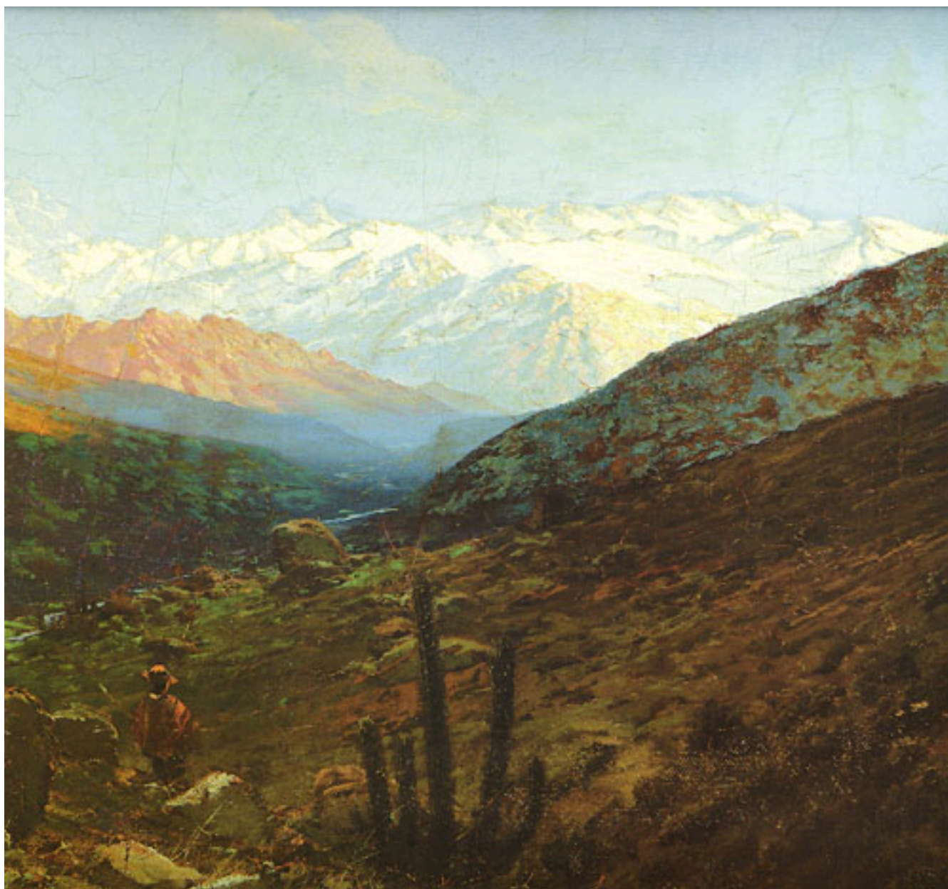
PAISAJE DEL ACONCAGUA