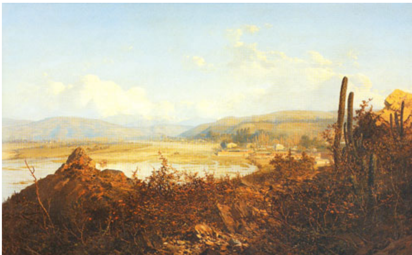
VISTA DEL MARGA MARGA