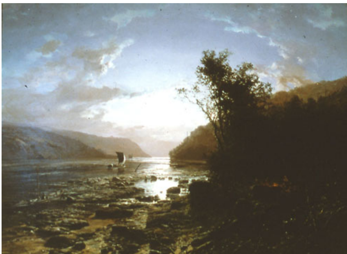
LANCHONES DEL MAULE NOCTURNO