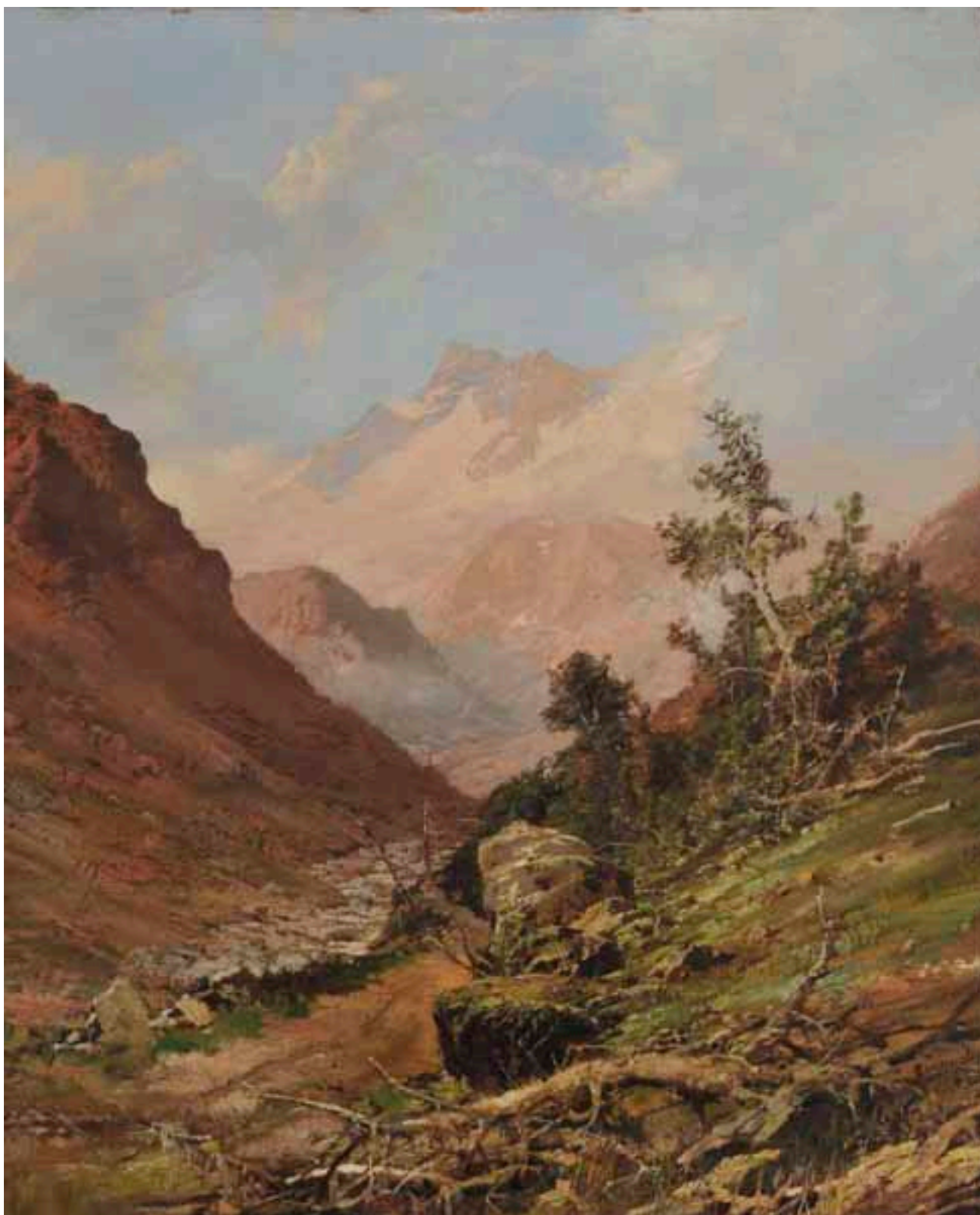
PAISAJE DE CORDILLERA