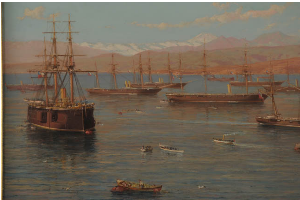
LA ESCUADRA CHILENA

BIBLIO/MNBA. Colección de Artículos de Prensa del artista THOMAS SOMERSCALES publicados en diarios y revistas entre los años 1905-2010.