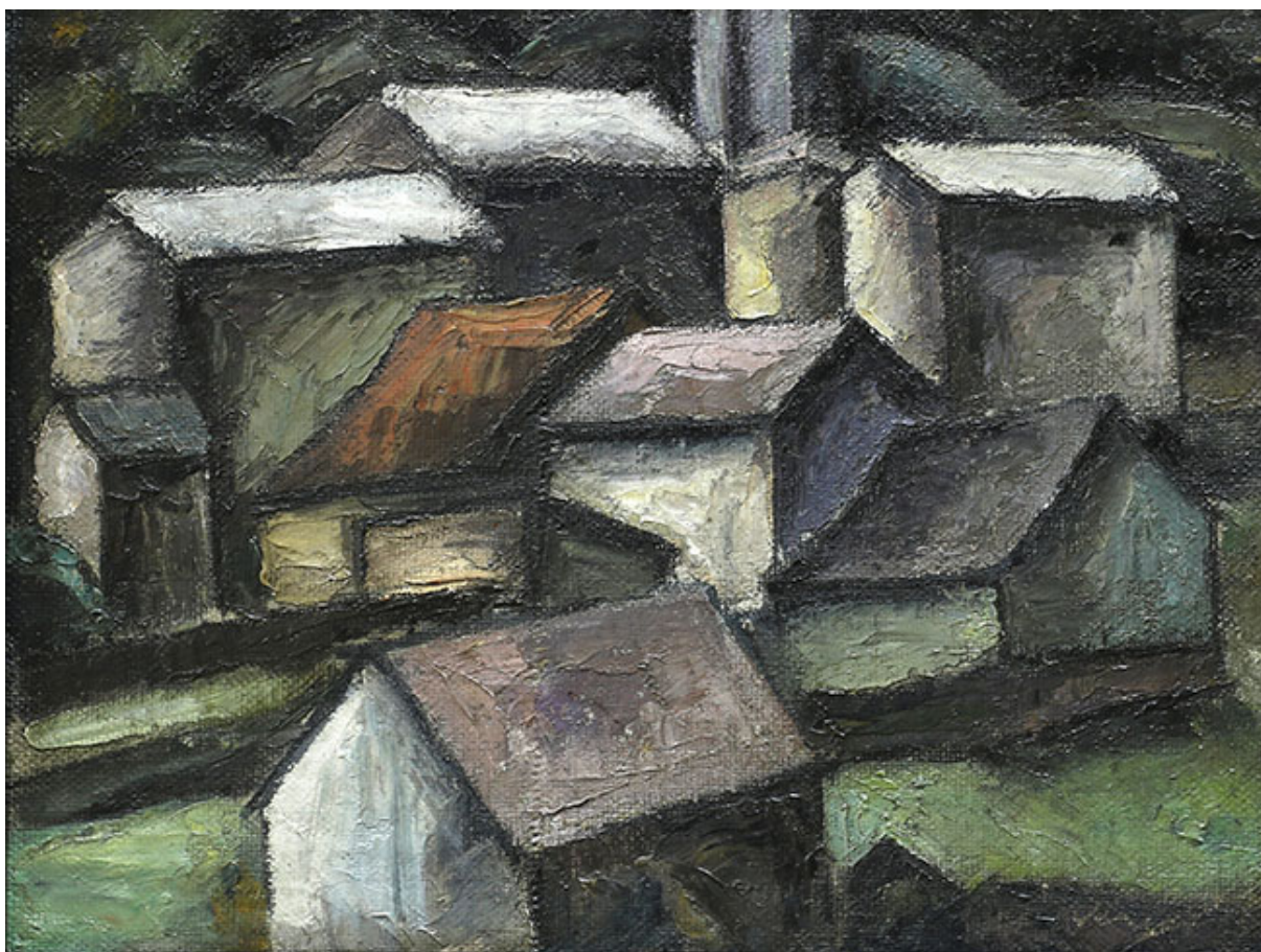
TECHOS DE PUERTO MONTT