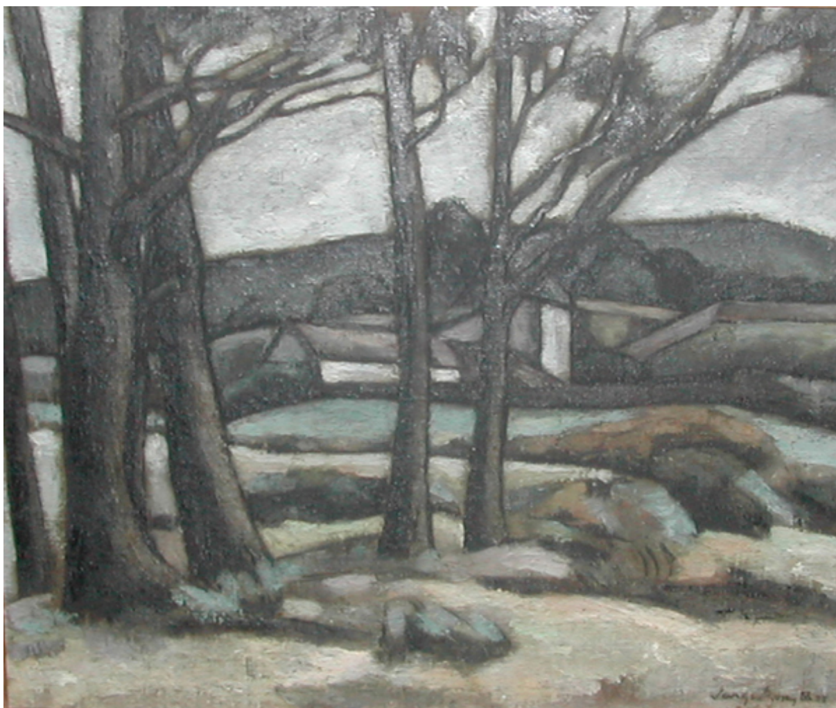
PAISAJE, PUERTO MONTT, 1925