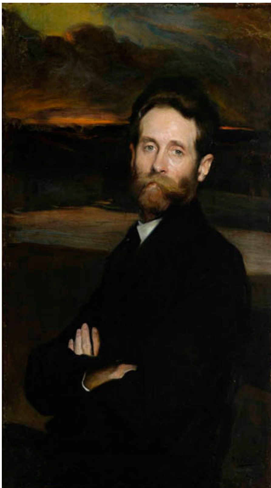
RETRATO DE PINTOR ALFREDO HELSBY