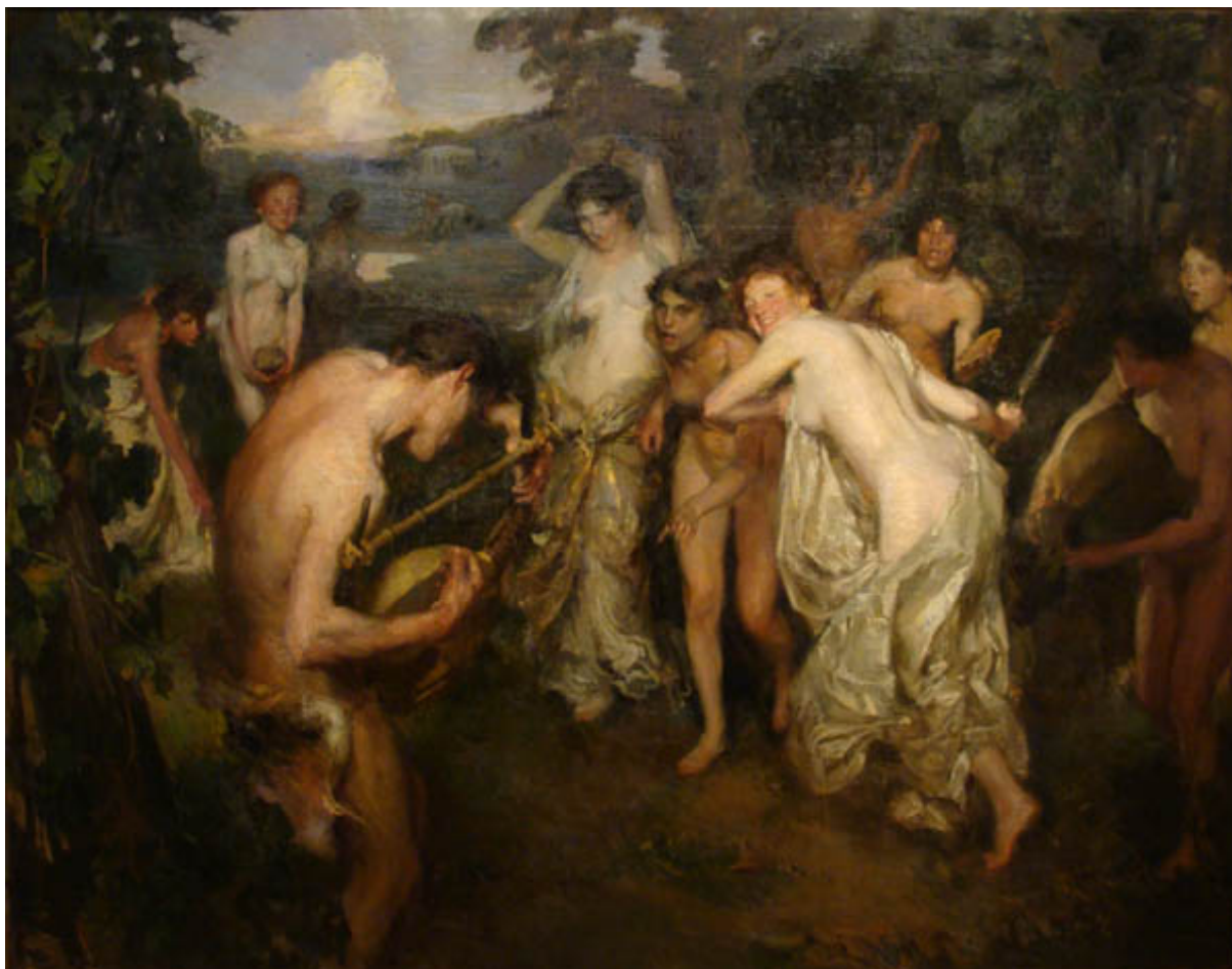
ORFEO ATACADO POR LAS BACANTES

ZAMORANO PÉREZ, PEDRO EMILIO. El Pintor F. Álvarez de Sotomayor y su Huella en América. La Coruña: Universidad de la Coruña, Servicio de Publicaciones, 1994.