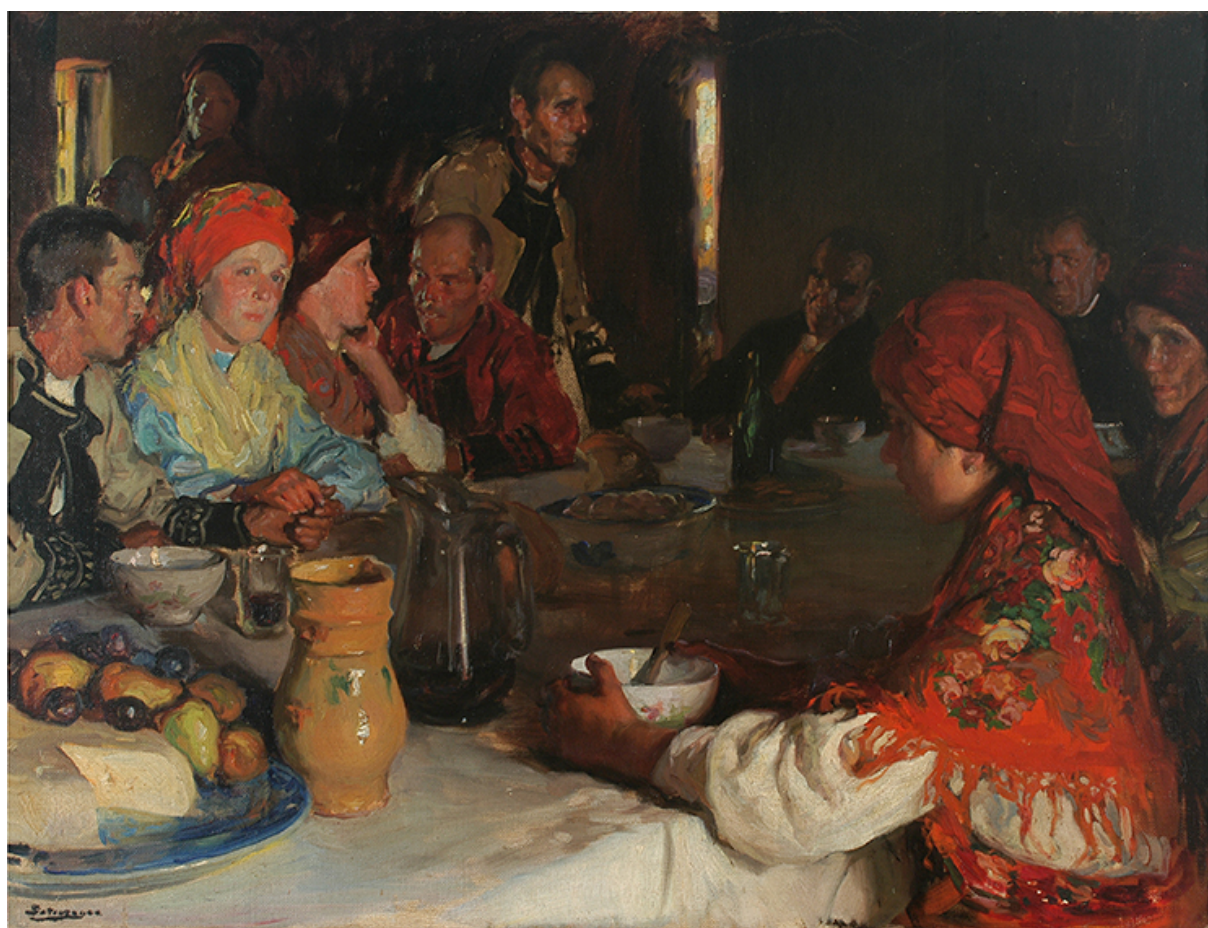
CENA GALLEGA ( Dpto. de Colección MNBA )