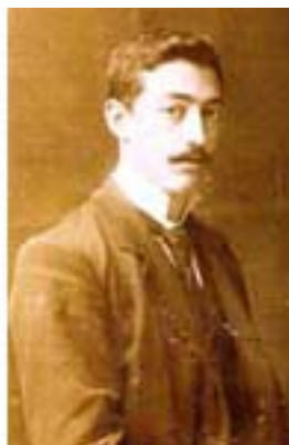
Fernando Álvarez de Sotomayor