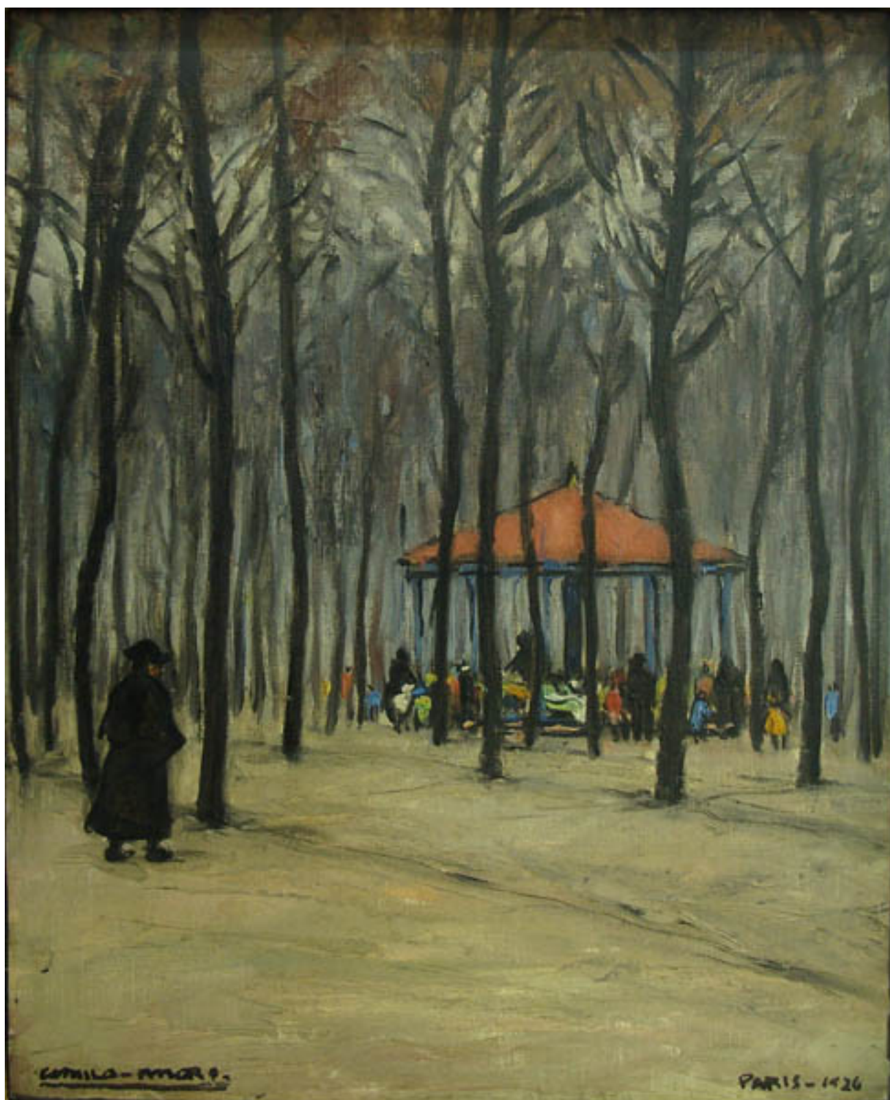
EL CARRUSEL DE LOS NIÑOS