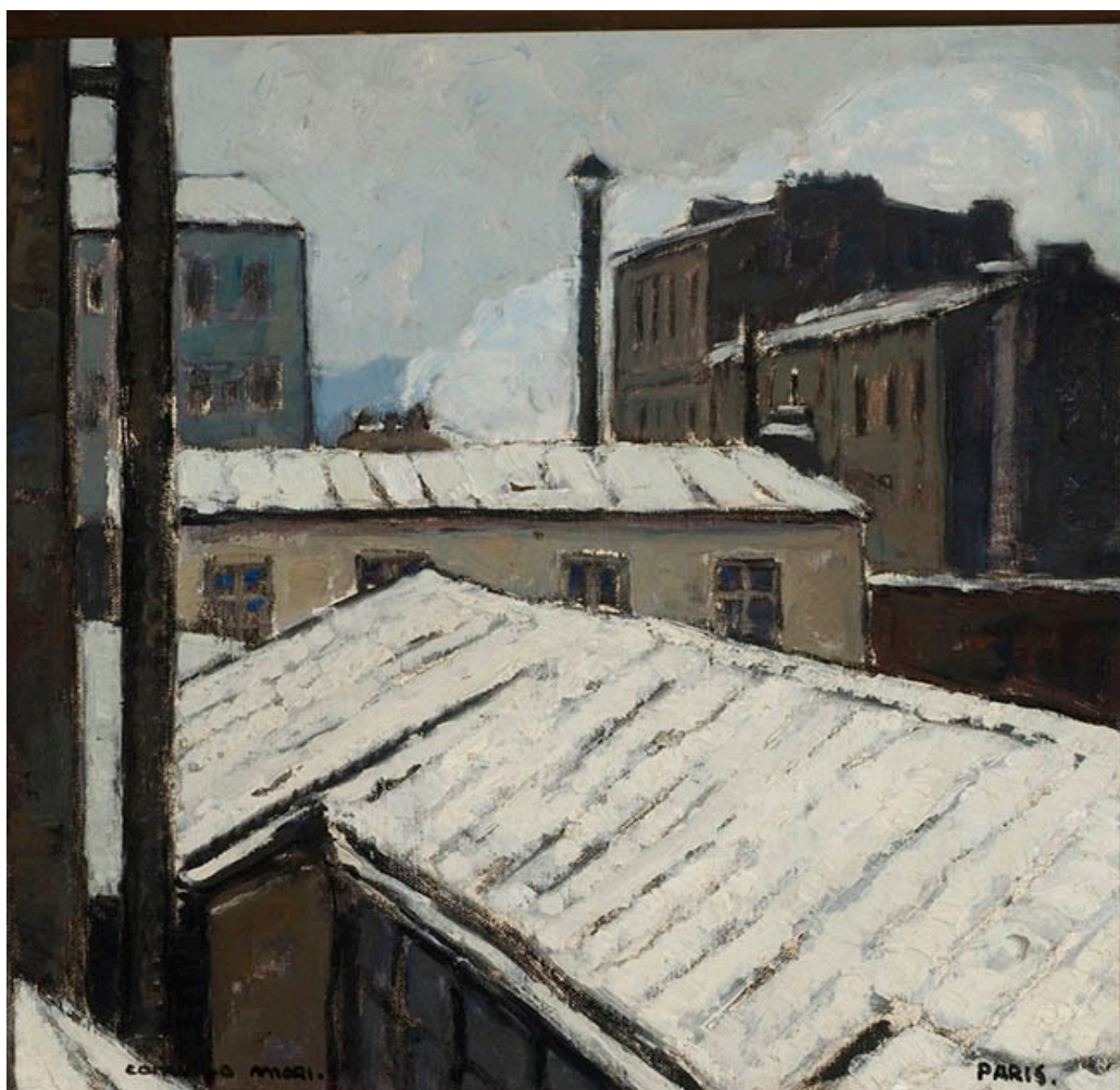
INVIERNO EN PARÍS