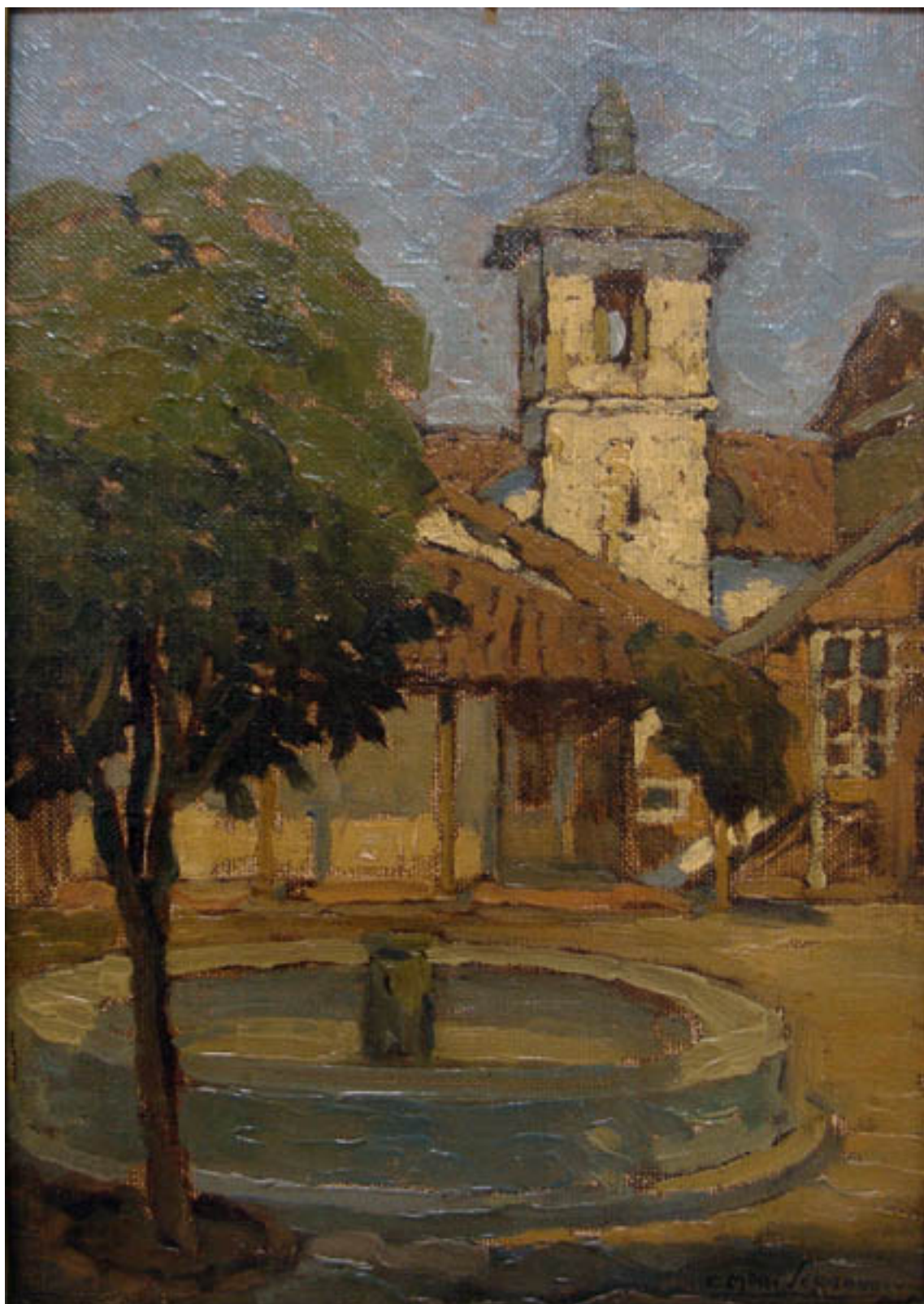
ANTIGUO CONVENTO DE LAS CAPUCHINAS