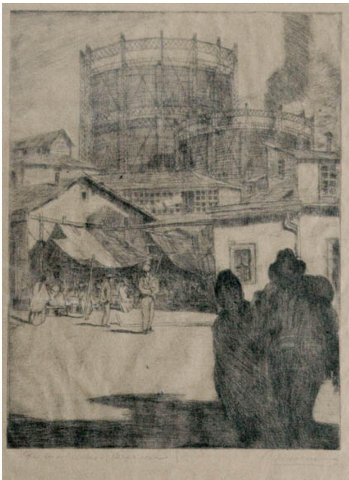
POR LOS SUBURBIOS (VALPARAÍSO)