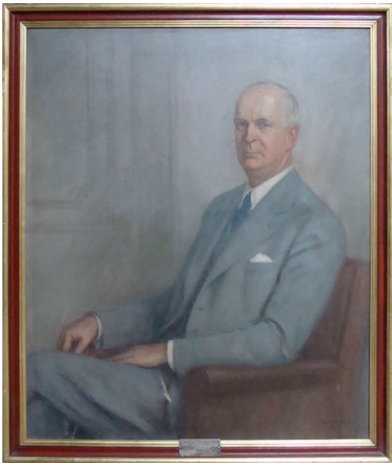
RETRATO DE AXEL SELANDER