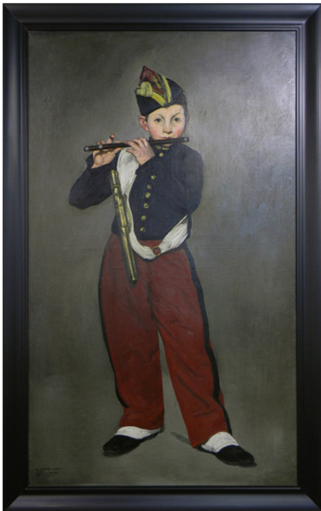
EL TOCADOR DE FLAUTA (Copia de Edouard Manet)